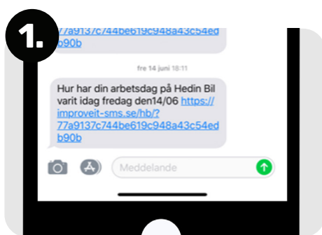
1. Medarbetaren får ett sms med en länk till enkäten.

Grundtanken med vår enkät är att medarbetarna ska få möjlighet att besvara frågor kring sin arbetssituation i direkt anslutning till arbetsdagen. Enkäterna är anonyma och går att anpassa helt utifrån era behov och du väljer själv hur ofta enkäten skickas ut – dagligen eller en gång i veckan. Du bestämmer också hur många frågor enkäten ska bestå av och hur frågorna ska vara uppbyggda. Systemet kan även anpassa frågor efter de svar som respondenten avger – skulle en medarbetare exempelvis svara att hen är missnöjd med dagen följer systemet upp med en fråga om varför.