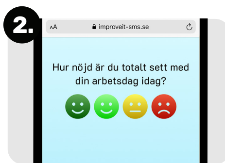
2. Medarbetaren svarar på en eller flera frågor. Svaren kan ges i form av smileys, femgradig skala eller reglage.